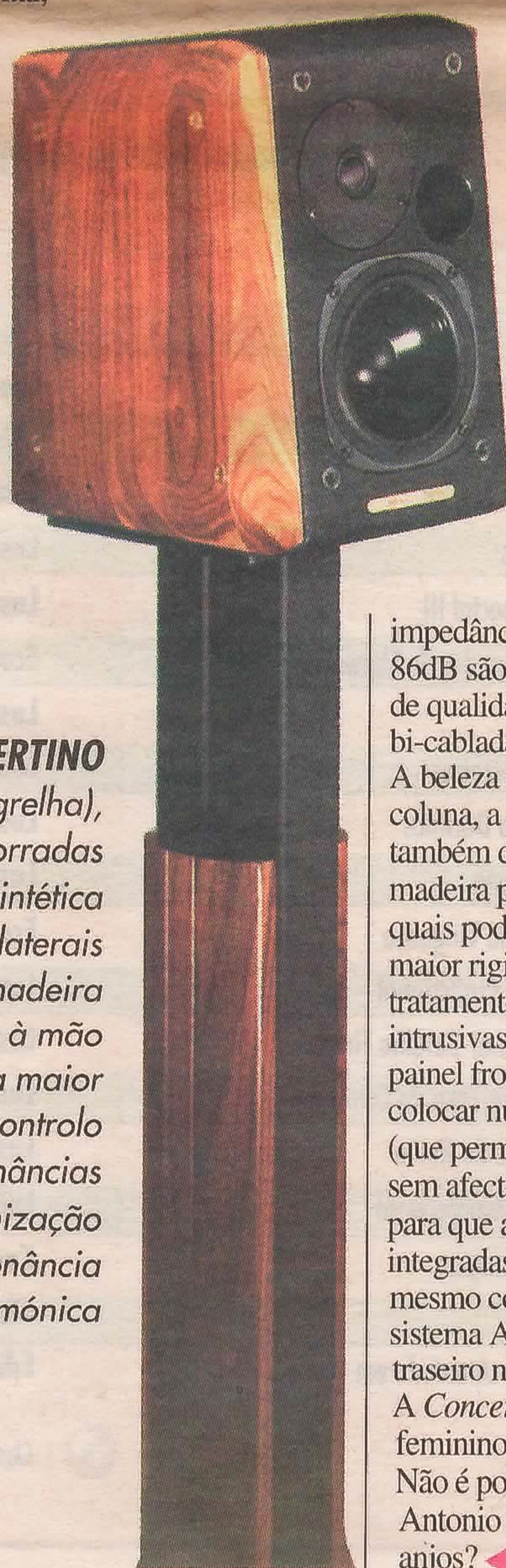
CONCERTINO (sem grelha), forradas a pele sintética e com painéis laterais de madeira polida à mão para maior controlo das ressonâncias e optimização da consonância harmónica

impedância de 8 ómios e a sensibilidade de 86dB são benignas para qualquer amplificador de qualidade. As Concertino podem ainda ser bi-cabladas.